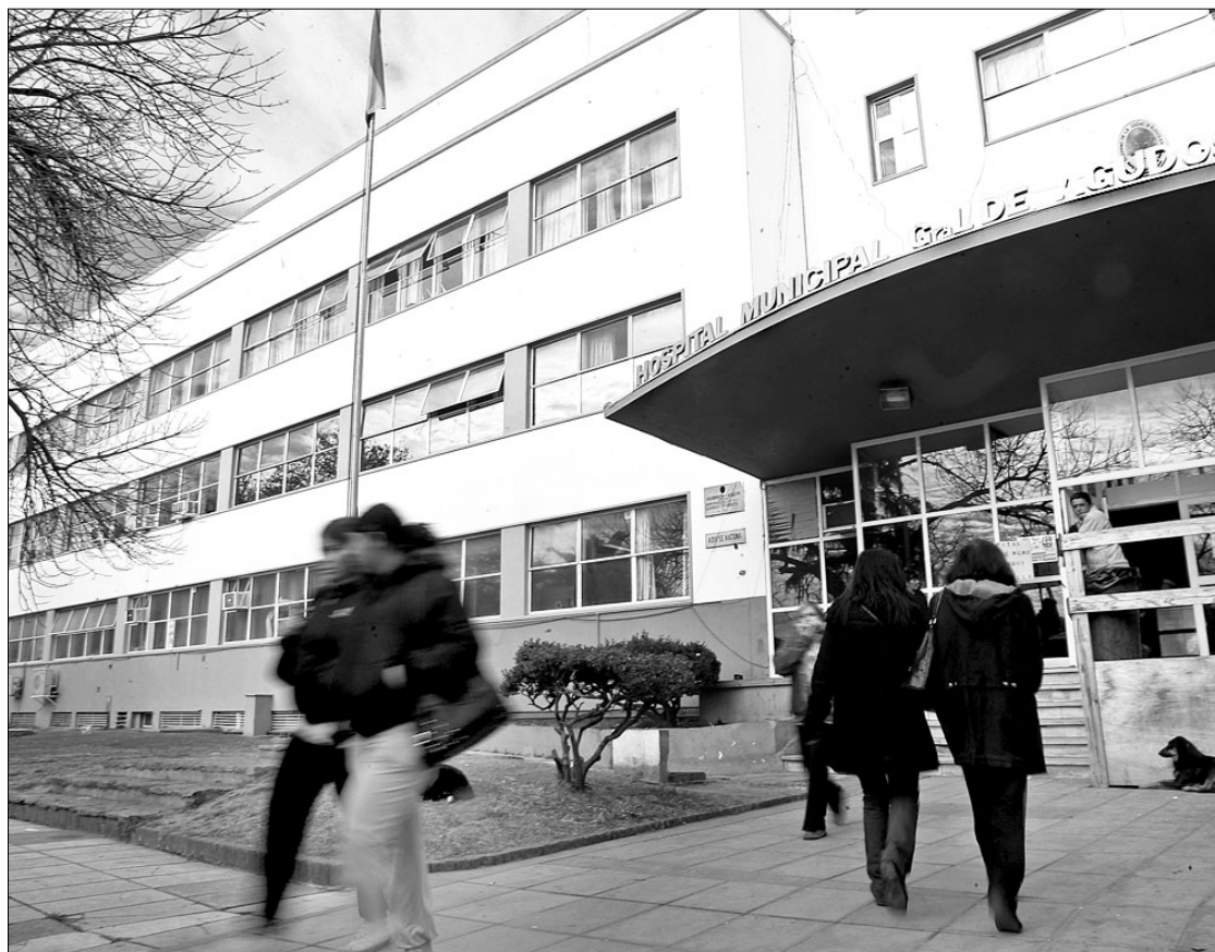
La política de Macri por el estado de los hospitales públicos es cuestionada por ONGs y por la oposición